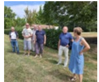
Les responsables à Labarthe

Aussi le Comité National des Quilles au Maillet, avec l'aide de la Fédération Française, proposera une journée découverte de la discipline, fin septembre ou début Octobre, cela permettra de faire le point de cette année un peu folle. La date et le lieu reste à définir.